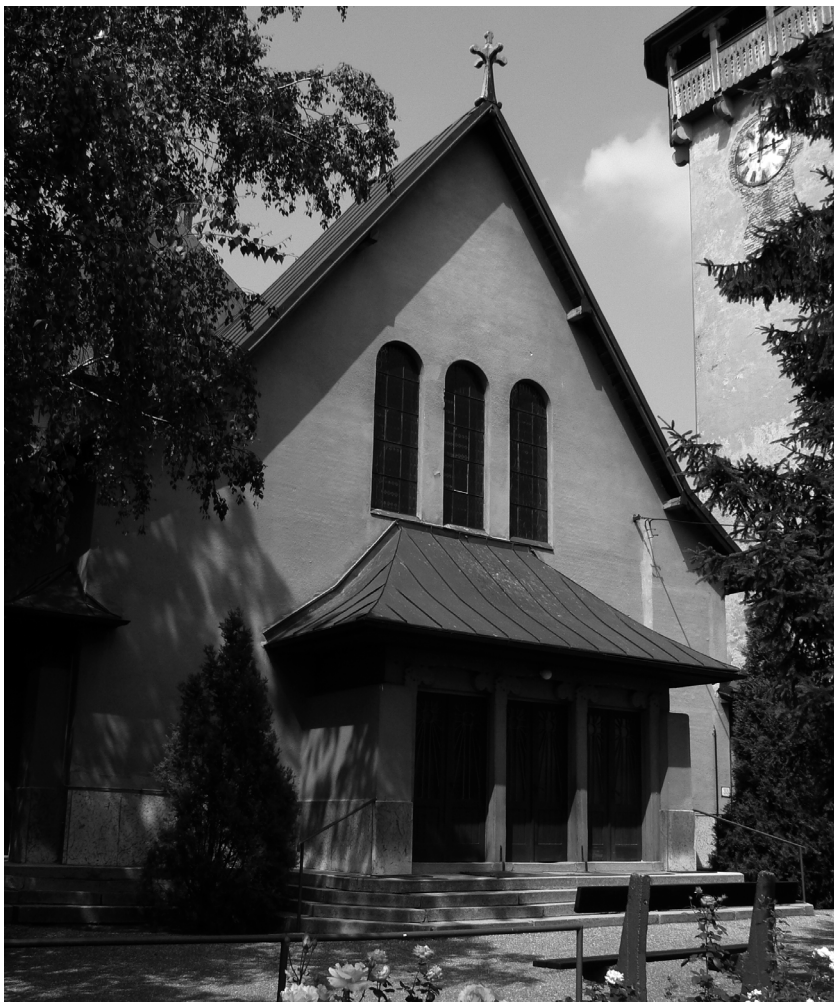
29. Medgyaszay István: Szent László r. k. templom, Ógyalla. (terv 1912). Külső nézet. Homlokzat a főbejáráttal.