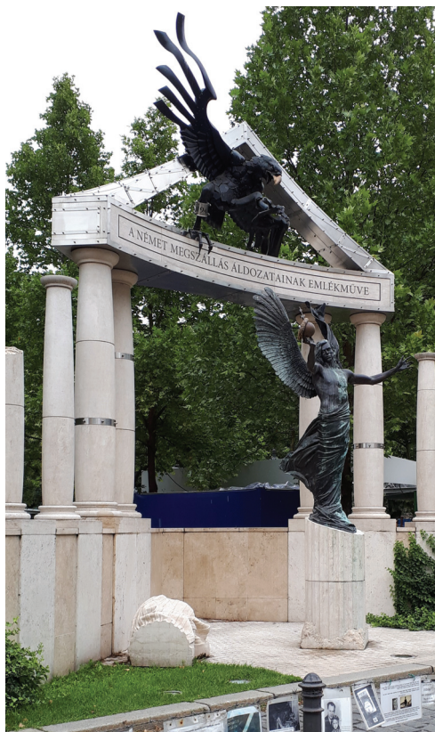
▲ A német megszállás emlékműve Budapesten.

gyen, a zsidó polgárok elleni aljasság, amit nem lehet elfelejteni, és amiben sajnos a magyarok is kivették a részüket. Ez is a mi történelmünk, nem? Miért kellett ebben részt vennünk... megint?! Ja persze, könnyű most és innen kritizálni egy kort. Vajon mi bátrabbak lettünk volna? De mégis, miért volt mindenhol körülöttünk annyi fegyveres ellenállás, annyi mozgalom és nálunk csak gyér megnyilvánulások? (Kivéve a Bajcsy-Zsilinszky által alakított rövid életű Magyar Nemzeti Felkelés Felszabadító Bizottsága, az MNFFB, és azt is áruházzal számolták fel a nyilasok). Mielőtt odaérkeztünk és kerestük a teret, megállítottunk néhány gyalogost és megkérdeztük, hol a tér, ahol az emlékmű áll. Senki nem tudta. Végül a Bajcsy-Zsilinszky két biztonsági őr beszélgetett egy intézmény előtt, ők tudták hol a tér, de az emlékműről nem sokat, őket sem érdekelte.